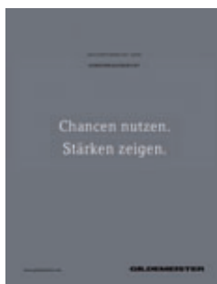
Gildemeister AG, Geschäftsbericht 2008