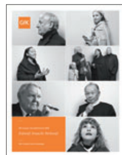
GfK AG, Geschäftsbericht 2008