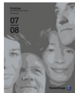
ThyssenKrupp AG, Geschäftsbericht 2007/2008

Die beste durchschnittliche Qualität unter den Teilbereichen des Lageberichts bescheinigten die Prüfer dem Nachtragsbericht, der mit 82,3% auch eine klare Steigerung zum Vorjahr (74%) verzeichnen konnte. Am schlechtesten schnitt dagegen der Prognosebericht mit 36,1% ab. Erstaunlich allerdings, dass sich auch hier die Bewertung trotz der Unsicherheiten aufgrund der Krise im Vergleich zum Vorjahr (35%) leicht verbesserte. Zwar lieferten rund 70 Unternehmen einen schlechteren Prognosebericht ab als 2007, bei der Mehrzahl der geprüften Geschäftsberichte ist die Prognosequalität jedoch gleich geblieben und sogar gestiegen.