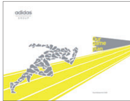
Adidas AG, Geschäftsbericht 2008

Die Marktforscher von GfK behaupteten mit einem um über zehn Prozentpunkte verbesserten Ergebnis den Spitzenplatz im SDAX. Die weiteren Plätze belegen die Deutsche Beteiligungs AG und der Vorjahreszweite Dyckerhoff. Auch auf europäischer Ebene setzte sich mit dem Schweizer Pharmakonzern F. Hoffmann-La Roche der Vorjahressieger unter den nichtdeutschen STOXX-Werten durch. Dagegen hatten es UBS und Royal Philips Electronics, deren Geschäftsberichte im aktuellen Wettbewerb den zweiten bzw. dritten Platz einnehmen, im vergangenen Jahr nicht unter die Top 3 geschafft.