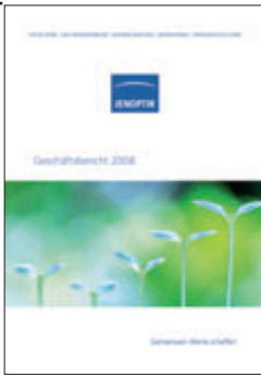
Jenoptik AG, Geschäftsbericht 2008