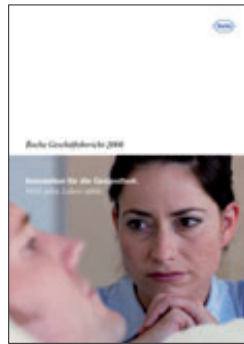
Roche AG, Geschäftsbericht 2008