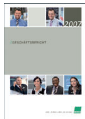
Bechtle AG, Geschäftsbericht 2007

In der Gruppe der TecDAX-Unternehmen konnte in diesem Jahr die Bechtle AG das Rennen knapp für sich entscheiden. Im SDAX lag das Marktforschungsinstitut GfK mit komfortablem Vorsprung vorne. Bei den nichtdeutschen Teilnehmern aus dem Stoxx 50 lieferte der Schweizer Pharmakonzern F. Hoffmann-La Roche mit einem Vorsprung von fast sieben Prozentpunkten ganz souverän den besten Geschäftsbericht ab. Im Gesamtranking reichte das Ergebnis al-