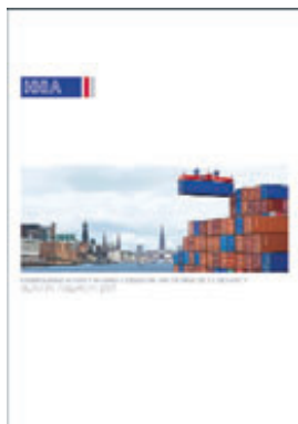
Hamburger Hafen und Logistik AG, Geschäftsbericht 2007

lerdings gerade einmal für Platz 16. Neben den Gesellschaften aus den Auswahlindizes der Deutschen Börse sowie dem Stoxx 50 wurden auch die Börsenneulinge, die sich im vergangenen Jahr im Prime Standard notieren ließen, in die Untersuchung mit einbezogen. Mit 64 von 100 möglichen Punkten, was gerade noch so einem „Gut“ entspricht, lieferte die Wacker Construction Equipment AG hier von zehn Gesellschaften den besten Jahresreport ab. Auf den Plätzen folgen Tognum sowie die Hamburger Hafen und Logistik AG.