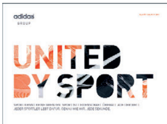
Adidas AG, Geschäftsbericht 2007

Nach Ausnahmen 2007 und 2001 hat mit der Adidas AG wieder ein Unternehmen aus dem DAX den besten Geschäftsbericht erstellt und sich damit gegen insgesamt 183 Mitbewerber durchgesetzt. Maßgeblichen Anteil an dem guten Ergebnis hatte dabei insbesondere auch der sehr gute Prognose- und Risikobericht. Die „enthronte“ Gildemeister musste sich in diesem Jahr knapp geschlagen geben und mit der Silbermedaille begnügen. Zurückzuführen ist dies im Wesent-